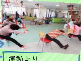
運動より トレーニング感覚！