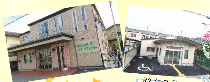
R3年7月に 拡張しました。

伊勢町の住宅街に、地域に密着したデイサービスとしてスタートしました。アットホームな雰囲気です。距離感が近いデイサービスとして親しまれています。はなぶさ苑で2番目にできた、デイサービスセンターなのです！