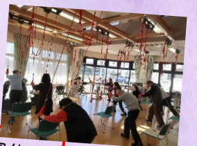
集団体操 (レド・コード)