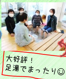
大好評！ 足湯でまったり☺