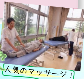
人気のマッサージ！