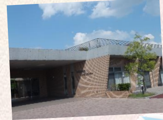
知らない人も結構多いのです！ 現在のデイケアのいきいき棟は、 平成22年3月に増築しました。

通所リハビリセンターは、熊谷市で初めてのデイケアとして誕生しました。現在でも熊谷市には、デイケアは7箇所しかありません。平成16年温泉掘削の翌年から敷地内で汲み上げた天然温泉(加温)と充実したリハビリが好評！