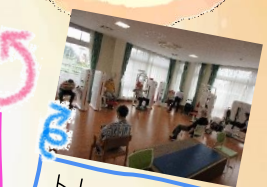
トレーニング マシンも充実

地域の方の声にお応えし、妻沼地区に開設！広いホールに、多彩なトレーニング機器と喫茶コーナー！運動したい方・ゆっくりしたい方まで多くの地元の方にご利用いただいております。ホールは昔、妻沼駅の駅舎があった場所にあります！「当時はこうだった」など、駅舎があった当時を楽しそうに思い出す方も多くいらっしゃいます！☺